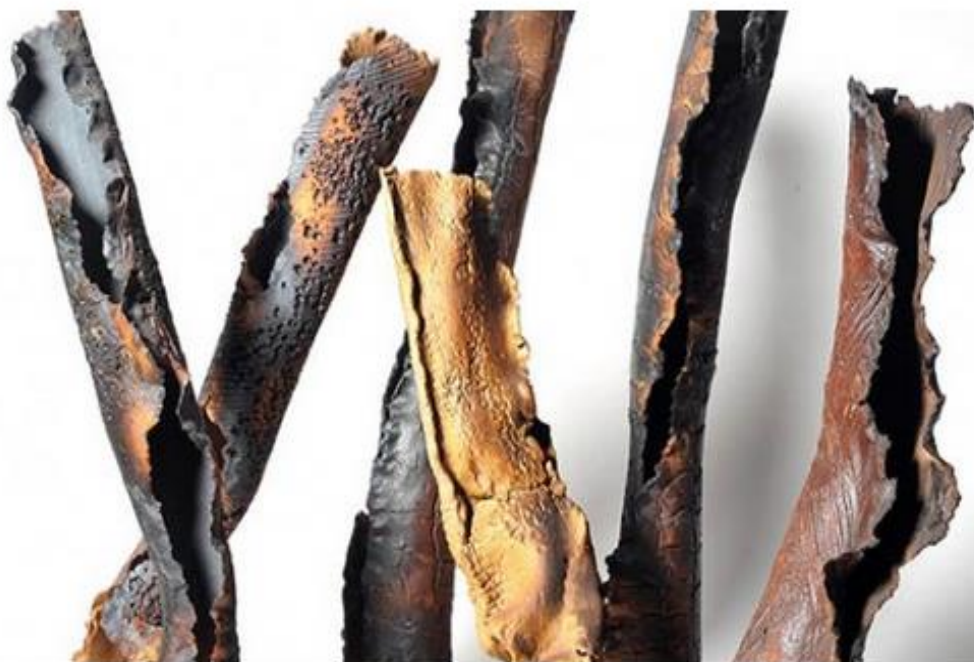
Maria Cristina Carlini Tronchi, 2014 grès, h cm 30/40, diam cm 10