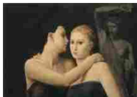
In Basilica Palladiana il sogno degli anni Venti e lo sguardo di Ubaldo Oppi