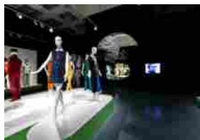
"Pierre Cardin. Fashion Futurist": la grande retrospettiva tedesca dedicata a Cardin | Bonaveri