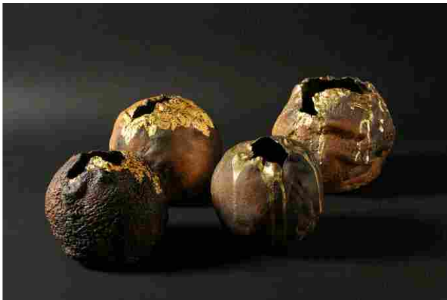
Maria Cristina Carlini Crateri 2016 grès diametro cm 20 cad

ARTESPRESSIONE Milano | mostra Maria Cristina Carlini Culture 12 Ottobre 2019